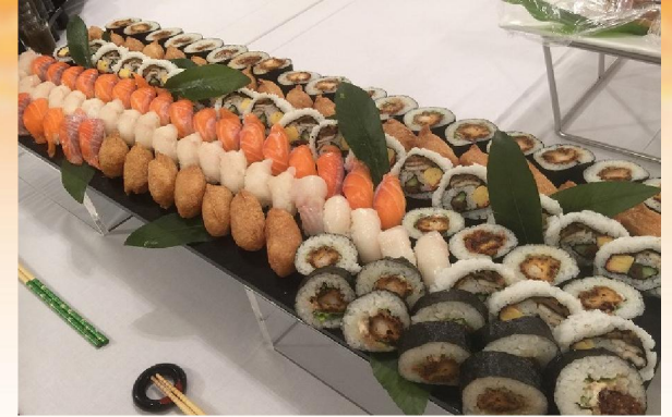
握り寿司・巻寿司