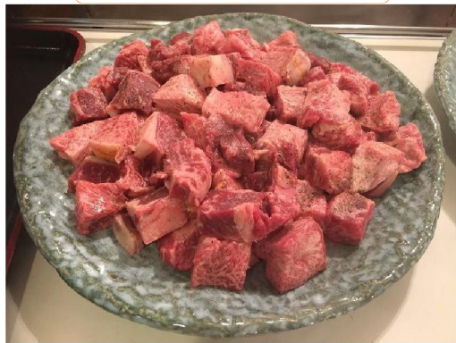
サイコロステーキ