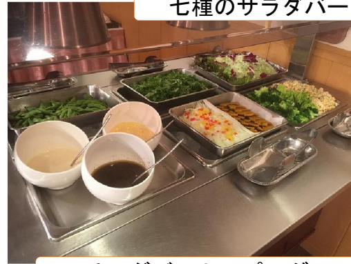
サラダバートッピング