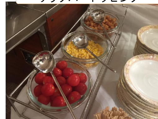
サラダバートッピング