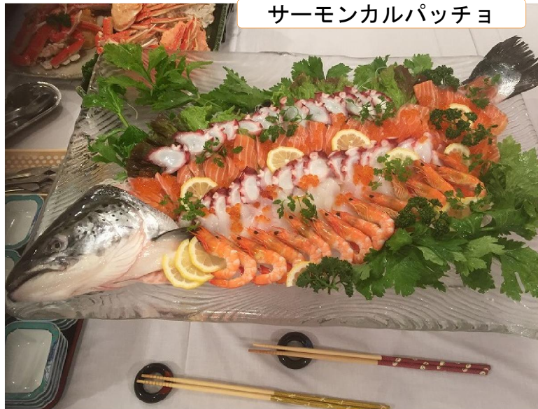
サーモンカルパッチョ