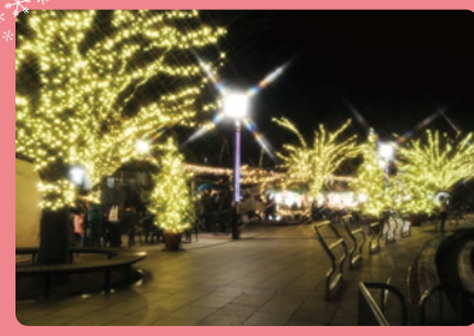
水のステージ前広場は、17本ものクリスマスツリーとイルミネーションで彩られる光の広場に大変身。週末には光の広場にクリスマスマルシェを開催。

クリスマスマルシェ 12/1(土)~12/24(月・祝)の土日祝 12/25(火) [時間] 11:00~21:00 人気の移動販売車が毎週末日替わりで登場! イルミネーションを眺めながら、こだわりの味をお楽しみください。