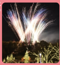
音楽と光、花火の融合 イルミネーション花火ショー